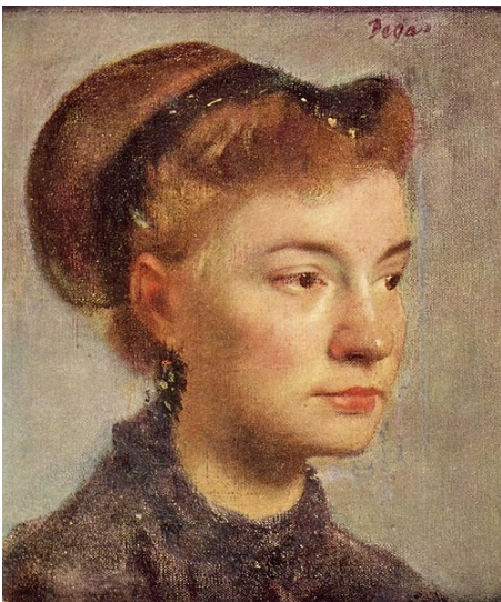
Edgar Degas Portrait de jeune femme 1867