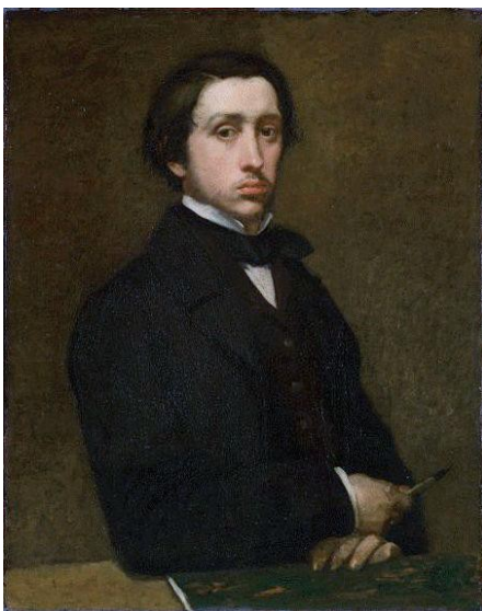
Edgar Degas Autoportrait 1854-1855

Huile sur toile et sur papier Musée d'Orsay Paris