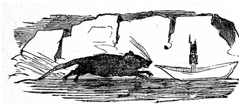
L'intrépide soldat de plomb Bertall

Afficher l'image et sa légende au tableau.