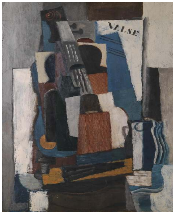
Nature morte cubiste, Louis Casimir Marcoussis, 1920

Avec le cubisme, les objets _____ ( sembler ) être aplatis ou éclatés en une multitude de facettes, et dessinés séparément. Par exemple, dans la représentation d'un visage, un œil _____ ( pouvoir ) être dessiné plus bas que l'autre. Ils s'exercent à peindre plusieurs points de vue en même temps : de face et de profil !