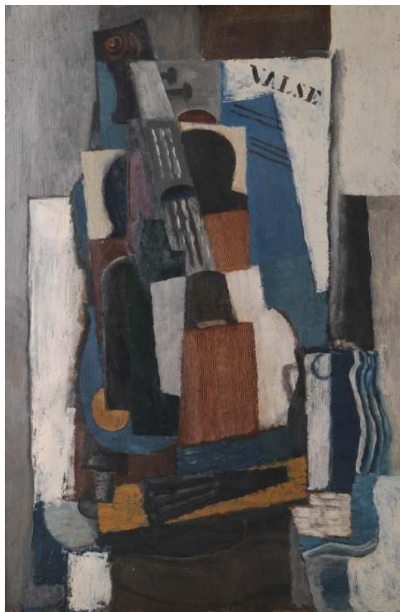
Nature morte cubiste, Louis Casimir Marcoussis, 1920

Avec le cubisme, les objets semblent ( sembler ) être aplatis ou éclatés en une multitude de facettes, et dessinés séparément. Par exemple, dans la représentation d'un visage, un œil peut ( pouvoir ) être dessiné plus bas que l'autre. Ils s'exercent à peindre plusieurs points de vue en même temps : de face et de profil !