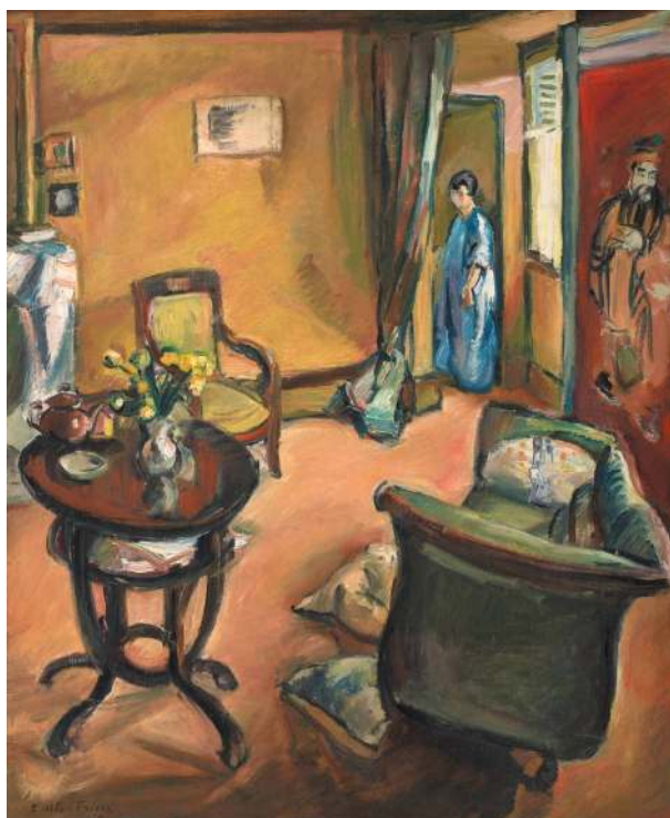
Intérieur, Émile Othon Friesz, 1914